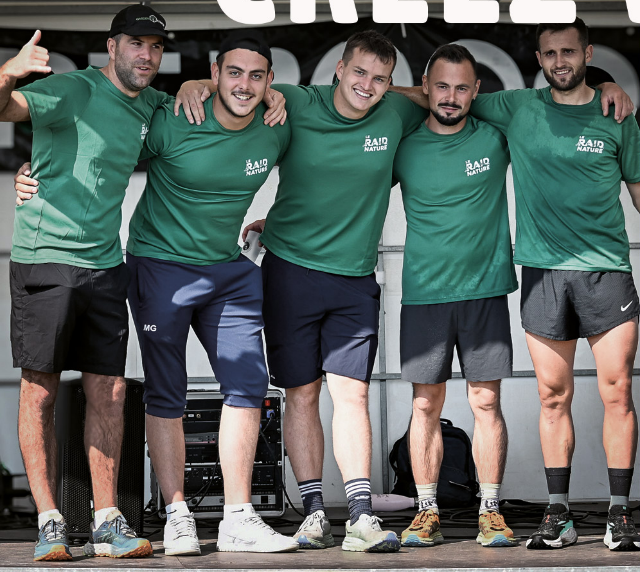
L'équipe "Garden concept", gagnante de l'édition 2024.

Entreprises, collectivités, associations, participez à un défi sportif unique, à la pointe du Finistère !